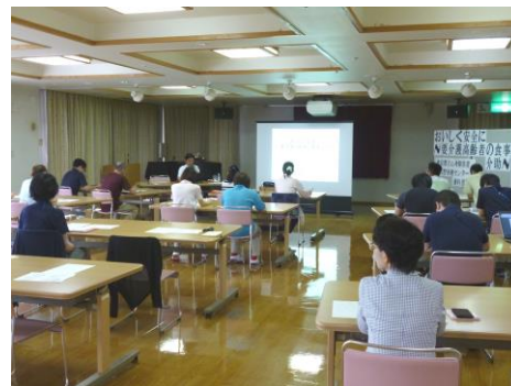
平成 28 年度は 19 施設で開催しました