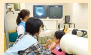
ビデオ嚥下造影検査