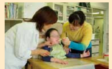
摂食嚥下機能療法