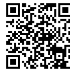
センター交通案内