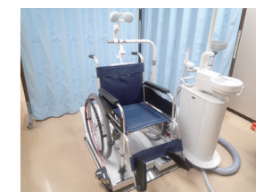
車椅子用ユニット