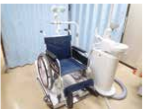
車椅子用ユニット