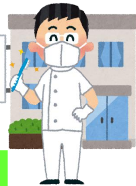
かかりつけ歯科医