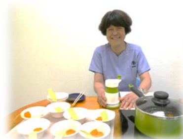
管理栄養士による調理実習を始めました！

令和元年より機能療法チームを立ち上げました。歯科医師3名・歯科衛生士5名・言語聴覚士1名・管理栄養士1名が連携をとり、チーム医療を行っています。