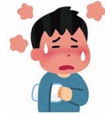
37.5℃以上ある方は入室いただけません