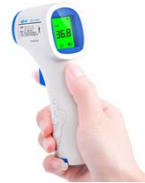
赤外線式の体温計