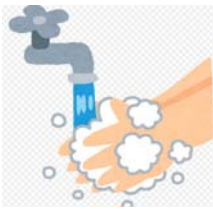
せっけんで手洗い