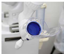
口腔外バキューム